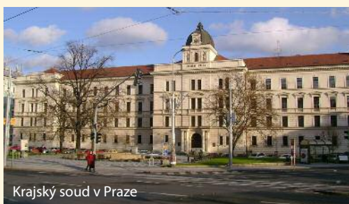
Krajský soud v Praze